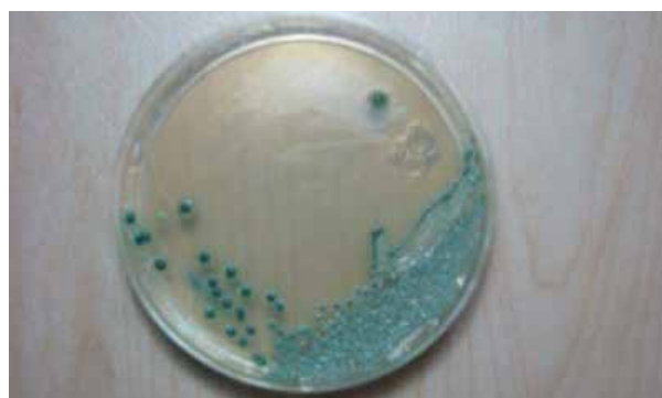
تصویر ۱: کلنی‌های سبز رنگ کاندیدا آلبیکنس بر روی محیط اختصاصی کروم آگار

بررسی اثرات غلظتهای مختلف داروی فلوکونازول در محدوده ۰/۲۵ تا ۱۲۸ میکروگرم در میلی لیتر بر رشد مخمرهای کاندیدا آلبیکنس نشان داد که این دارو از طریق وابسته به غلظت قادر به مهار رشد ارگانیسما در برخی از غلظتهای به کار گرفته شده می‌باشد. میانگین مقادیر MIC و MFC جدایه‌های کاندیدا آلبیکنس به ترتیب ۲۸/۸ تا ۵۴ میکروگرم در میلی لیتر و ۳۳/۲۵ تا ۹۰ میکروگرم در میلی لیتر بودند. میانگین میزان MIC فلوکونازول برابر جدایه‌های مختلف کاندیدا آلبیکنس حدود ۴۵/۳۸ میکروگرم در میلی لیتر بود، درحالی که میانگین میزان MFC برابر ۶۳ میکروگرم در میلی لیتر محاسبه شد (جدول ۲). تمام جدایه‌های کاندیدا آلبیکنس حساس وابسته به دوز بودند.