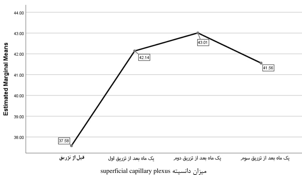
شکل ۱: میانگین‌های دانسیته superficial capillary plexus

شکل ۱ حاصل از تحلیل اندازه‌های مکرر است که روند بین میانگین‌های دانسیته superficial capillary plexus را در چهار اندازه‌گیری نشان می‌دهد.