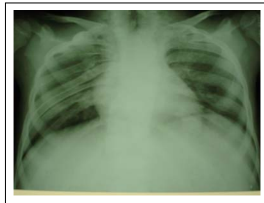
تصویر ۱: گرافی رخ قفسه سینه که نشاندهنده آنومالی وسیع دنده ها در همی توراکس چپ می باشد

سابقه خانوادگی ضعف عضلانی در دختر دایی خود داشته است. در معاینه فیزیکی بیمار دچار کوتاه قدی و کاهش وزن شدید (هر دو زیر منحنی ۳ پرستتایل) بوده، گردن کوتاه و دارای محدودیت حرکت واضح، خط رویش مو در پشت سر پایین تر از حد معمول، قفسه سینه نامتقارن و در سمت چپ برجسته تر از طرف راست، اسکولیوز شدید بدون کیفوز قابل توجه، معاینه قلب و ریه وشکم نرمال، اندام فوقانی چپ دچار انقباض مداوم انگشتان ۳، ۴ و ۵، اندام تحتانی دچار فلج اسپاستیک دو طرفه و پای چماقی بخصوص در سمت راست بود. بیمار از نظر تکامل مغزی و بهره هوشی کاملا نرمال بود. در آزمایشات انجام شده کشت ادرار مثبت با ای کولای، در آزمایش خون لوکوسیتوز و در گرافی قفسه سینه آنومالی وسیع مهره ها بصورت همی ورتبرا، مهره پروانه ای، مهره های گردنی بهم چسبیده، آنومالی های دنده ها بصورت بهم چسبیدن دنده ها بخصوص در سمت راست و در گرافی لومبوساکرال آنومالی وسیع مهره ها و آژنزی دنبالچه مشاهده می شد (تصویر ۱).