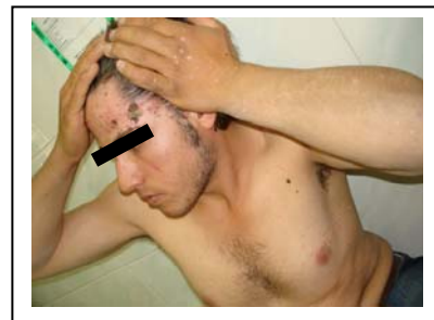
تصویر ۱: پلاکهای هیپرکراتوتیک صورت، پاپولهای مسطح پشت دست ها، ماکول های اریتما تو و هیپوپیگمانته بر روی تنه و ساعد وی ذکر می کند از سن ۱۲ سالگی به بعد، در برخی از ضایعات صورتش افزایش ضخامت و تغییر شکل، همراه با ایجاد زخم های مزمن رخ داده است (تصویر ۲).

بیمار پسر ۱۹ ساله ای است که اهل و ساکن شهرستان کبودرآهنگ استان همدان می باشد. وی از اوایل کودکی دچار ضایعات پاپولر متعدد بر روی صورت، دست ها و پاها، همراه با ضایعات ماکولر هیپرو هیپوپیگمانته، بر روی تنه و اندام فوقانی و پلاک های قرمز رنگ در ناحیه پیشانی گردیده است (تصویر ۱).