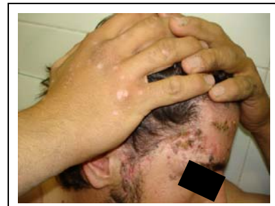
تصویر ۲: نمای نزدیک تغییرات متعدد دیسپلاستیک و بدخیمی صورت، همراه با پاپول های مسطح زگیلی پشت دست