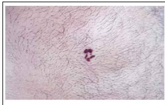
شکل ۲: سرطان سلول قاعده ای روی شکم

میزان درگیری ساعد و دست ۸ مورد BCCs را شامل می‌شد که ۵ مورد (۱۰/۴٪) در نواحی ساعد و ۳ مورد (۶/۳٪) در دست‌ها قرار داشتند. از ۱۱ مورد BCCs اندام تحتانی، ۱ مورد (۲/۱٪) روی کپل، ۲ مورد (۴/۲٪) در ران‌ها، ۳ مورد (۶/۳٪) روی ساق، ۳ مورد (۶/۳٪) روی پاها و ۲ مورد (۴/۲٪) در کشاله ران قرار داشتند. از ۲ مورد BCCs (۴/۲٪) ناحیه تناسلی خارجی، هر ۲ مورد بر روی ولو قرار داشتند.