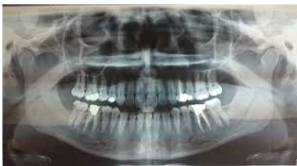
تصویر ۴: رادیوگرافی نرمال ناحیه مندیبل

آرامی پیشرفت کرده بود. هیچ ناتوانی عملکردی یا درگیری عصبی دیگری وجود نداشت. بیمار هیچ سابقه‌ای از بیماری دیگری نداشت و کاملاً سالم بود. سابقه خانوادگی و زمینه‌ای از بیماری‌های استخوانی و بافت نرم وجود نداشت. علاوه بر احساس کشیدگی پوست در هنگام لمس، یک خط تیره فرو رفته در سمت راست چانه دیده می‌شد. در ناحیه گرفتار تندر نس وجود نداشت. همچنین در معاینه دهان، نیمه راست زبان نیز آتروفیک بود (تصاویر ۱ و ۲).