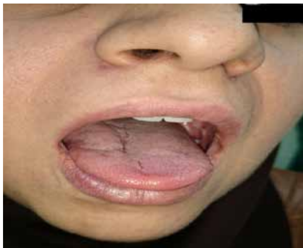
تصویر ۱: آتروفی نیمه راست زبان

آرامی پیشرفت کرده بود. هیچ ناتوانی عملکردی یا درگیری عصبی دیگری وجود نداشت. بیمار هیچ سابقه‌ای از بیماری دیگری نداشت و کاملاً سالم بود. سابقه خانوادگی و زمینه‌ای از بیماری‌های استخوانی و بافت نرم وجود نداشت. علاوه بر احساس کشیدگی پوست در هنگام لمس، یک خط تیره فرو رفته در سمت راست چانه دیده می‌شد. در ناحیه گرفتار تندر نس وجود نداشت. همچنین در معاینه دهان، نیمه راست زبان نیز آتروفیک بود (تصاویر ۱ و ۲).