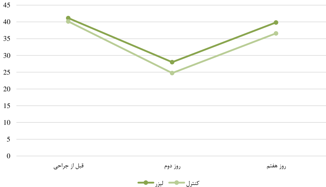
شکل ۲: مقایسه میزان حداکثر باز شدن دهان (تریسموس) در دو گروه مورد مطالعه در زمان‌های مختلف