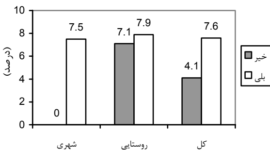
نمودار ۳: فراوانی نسبی زنان باردار شهری و روستایی دارای IgM ضد توکسوپلازما در خرم‌آباد بر حسب تماس با گوشت تازه در سالهای ۸۶-۸۵

عیار مثبت IgM در بین زنان بارداری که با گوشت تازه تماس داشتند برابر 7/6\% درصد و در افرادی که با گوشت تازه تماس نداشتند 4/1\% درصد بود، هر چند که از نظر آماری این اختلاف معنی دار نبود (نمودار ۳).