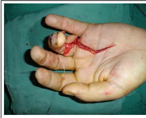
شکل ۴: ترمیم تاندون فلکسور عمقی به پایه استخوان فالنکس دیستال با سیم فولادی Pull out suture

به خاطر چروکیده شدن سیستم پولی و ادماتوز بودن تاندونهای آسیب دیده، تصمیم گرفته شد که اکسیزیون تاندون فلکسور سطحی به عمل آمده و تاندون فلکسور عمقی ترمیم شود (شکل ۴).