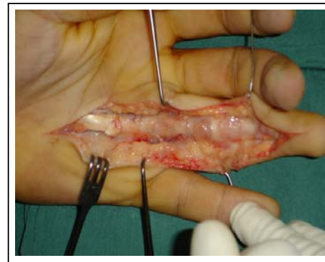
شکل ۲: سیستم پولی از تاندونها خالی است

تحت بییهوشی عمومی و با استفاده از تورنیکه توسط انسیزیون زیگ زاگ و در سطح ولار به سیستم فلکسور ابروچ شد. قسمت پروگزیمال تاندونهای فلکسور به کف دست کشیده شده بود. (شکلهای ۲ و ۳).