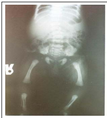
تصویر ۷: دنده های باریک، استخوان های توبولر کوتاه خارهای اسپیکال و هیپوپلازی لگن (بیمار دوم)

در بررسی رادیوگرافی کامل اندامها و تنه کوتاهی استخوانهای دراز، بالهای ایلیاک کوچک همراه برجستگی خار مانند قسمت داخلی سقف استابولوم، دنده های کوتاه و ستون فقرات طبیعی مشاهده گردید (تصویر ۷).