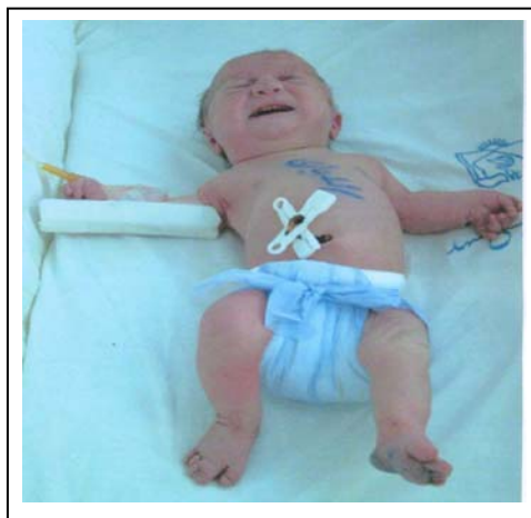
تصویر ۶: بیمار دوم

دیسپلازی اکتودرمال در حدود ۹۳٪ بیماران مبتلا گزارش شده (۱) و بصورت ناخن های هیپوپلاستیک یا دیستروفیک، مشکلات دندانی از جمله دندان نوزادی، دندانهای کوچک و تأخیر در درآمدن دندان می باشد. لب فوقانی در این بیماران باریک و توسط فرنولوم های متعدد به لثه متصل می شود (۱،۸). در بیماران مطالعه حاضر همه تظاهرات فوق وجود داشتند.