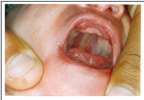
تصویر ۴: دیس پلازی لثه و فرنولوم کوتاه (بیمار دوم)