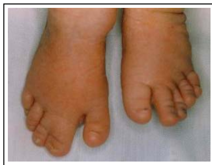
تصویر ۵: سین داکتیلی و پلی داکتیلی پای راست (بیمار دوم)

علت دیسترس تنفسی دربخش نوزادان بستری شد. والدین بیمار خویشاوند درجه ۳ بوده و فرزند قبلی آنها نیز دو سال قبل با تابلوی شدیدتر این بیماری در سن ۳ ماهگی فوت کرده بود. در معاینه حفره دهانی نوزاد دیس پلازی لثه فوقانی و تحتانی همراه با فرنولوم های کوتاه و متعدد مشهود بود. قفسه سینه باریک و اندامهای فوقانی تحتانی کوتاهی اکروموملیک داشتند. پلی داکتیلی در سمت اولنار در هر دو دست همراه با هیپوپلازی ناخن ها مشهود بود. پلی داکتیلی در پای راست همراه با چسبندگی انگشت دوم و سوم پای راست دیده می شد (تصویر ۳-۶).