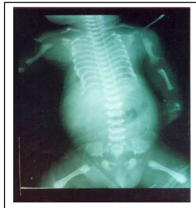
تصویر ۲: دنده های کوتاه، کوتاهی استخوانهای توبولر، لگن هیپوپلازیک با خارهای اسپیکال (بیمار اول)