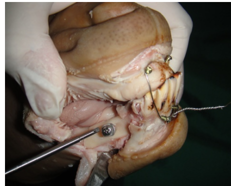
شکل ۱: TRS جایگذاری شده

برش پوستی (علاوه بر برش قبلی داخل دهانی) در بردر تحتانی ماندیبل داده می شد و بعد در حالیکه دندانها توسط IMF در اکلوزن بودند فورسپس جاناندازی از خارج دهان در محل شکستگی جاسازی شده و سپس قطعات شکسته با استفاده از سه عدد پیچ ۱۱ میلیمتری به صورت مثلی و با تکنیک Lag Screw فیکس می شدند (شکل ۲).