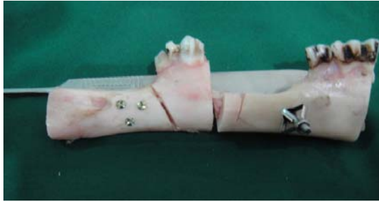
شکل ۳: قطعات Fix و خارج شده TRS و روش مرسوم

اطلاعات به دست آمده پس از وارد کردن در نرم افزار آماری SPSS-۱۶ با استفاده از آزمون های آماری کای اسکوئر و دقیق فیشر مورد تجزیه و تحلیل قرار گرفتند.